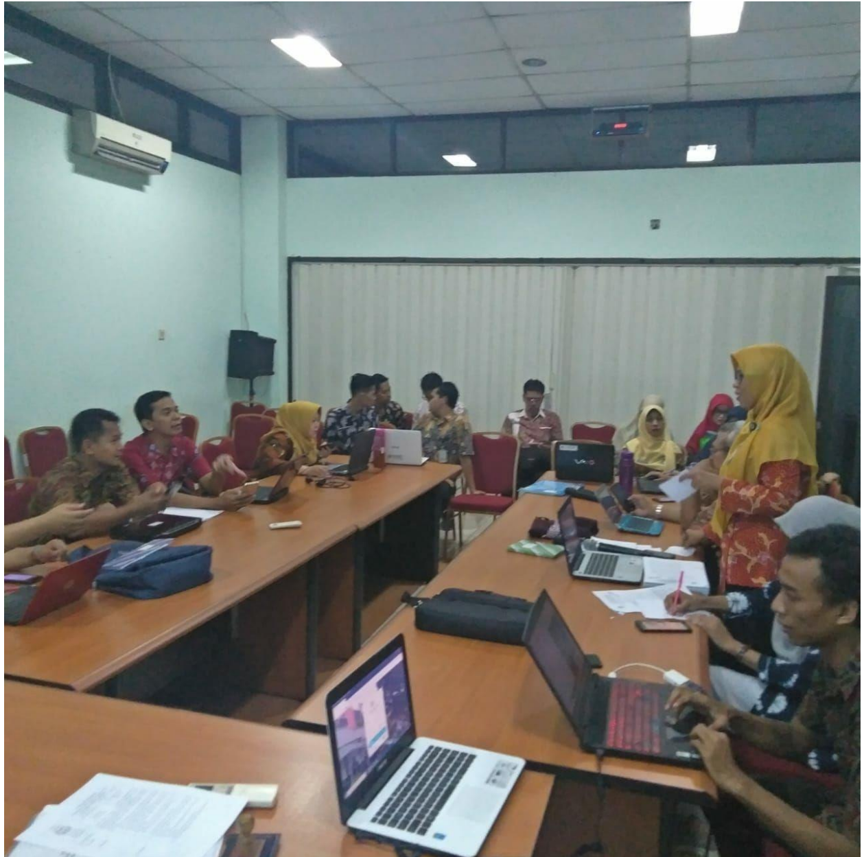
FOTO RAPAT EVALUASI PENGADUAN SEMESTER II